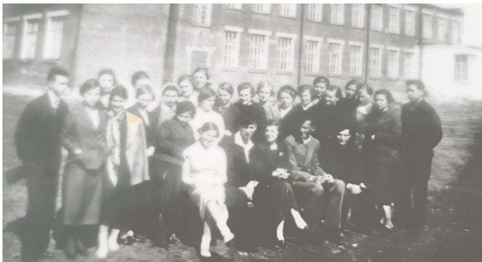
Выпускники 30-х годов.